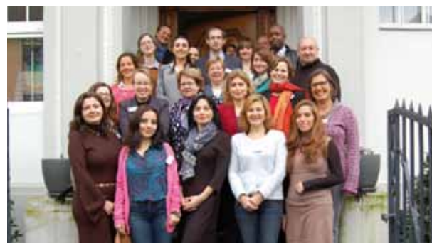
Die Teilnehmerinnen und Teilnehmer des Repräsentantenworkshops im Februar 2016

Dreimal jährlich lädt der SES seine Repräsentantinnen und Repräsentanten aus dem Ausland zu einer Arbeitswoche nach Deutschland ein. Die Treffen mit je zehn bis 15 auswärtigen Gästen finden in der SES-Zentrale in Bonn statt. International wie immer ging es auf dem jüngsten Workshop im Februar 2016 zu: mit den Vertreterinnen und Vertretern des SES aus Argentinien, Armenien, Aserbaidschan, Bolivien, Kasachstan, Marokko, Namibia, Ruanda, Sambia, Simbabwe, Tunesien, der Ukraine und Usbekistan. Insgesamt gehören dem SES-Repräsentantennetz derzeit rund 180 Personen und Institutionen in 90 Ländern an.